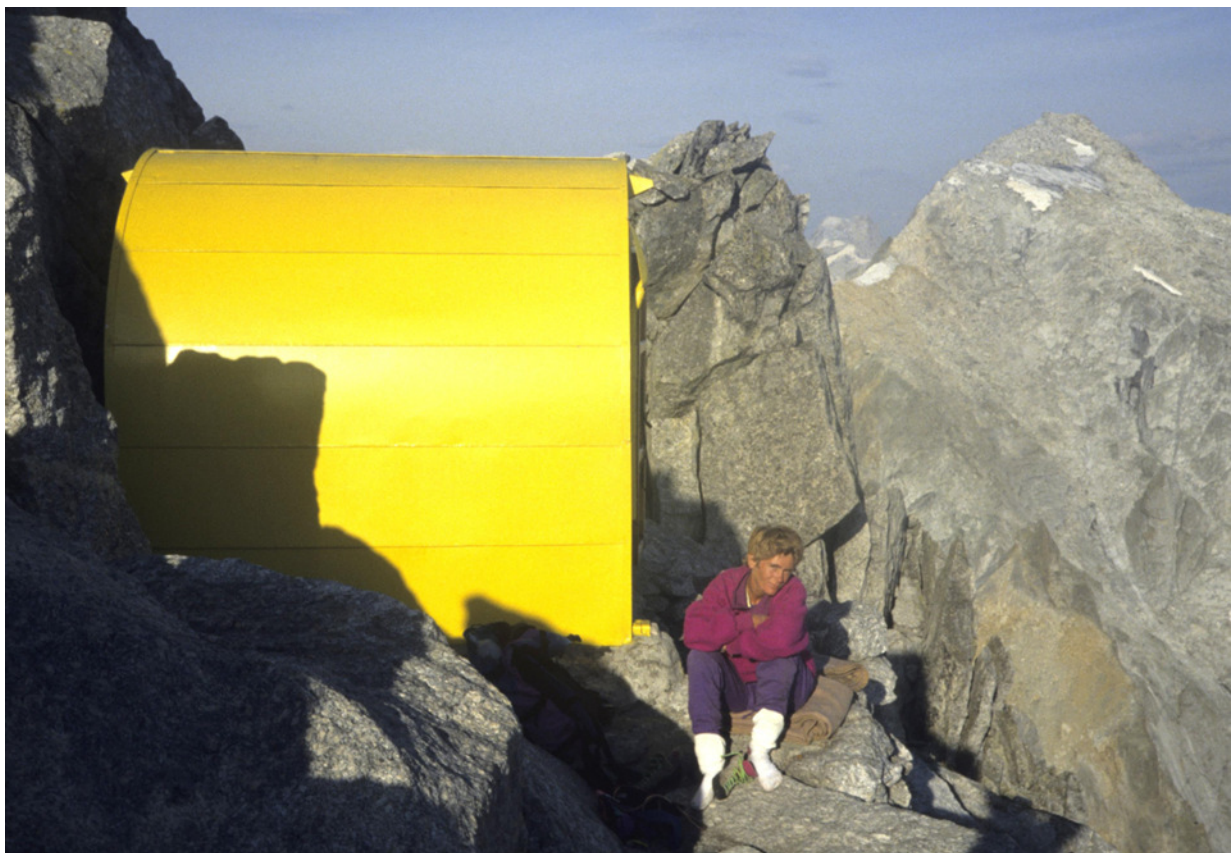
Abb. 2 Die Biwakschachtel am Gipfel

Die Tour gehört sicher zum Besten, was ich geklettert bin. Trotz anderer lohnender Touren in dieser Wand wird es aber mein letzter Besuch des Cengalo-Couloirs bleiben.