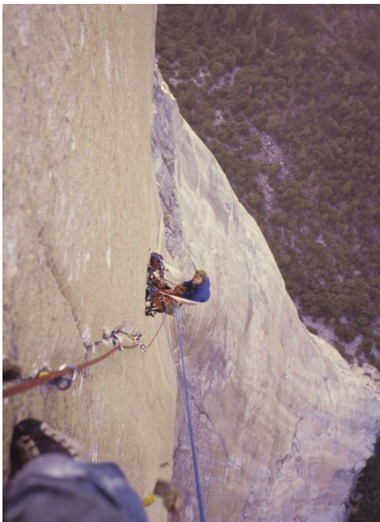
Abb. 1 Hängemattenbiwak am Shield

Unverstand trotz des Nieselregens weiter klettern wollte. Beim Abseilen knallte dann noch ein fetter Stein auf meinen Helm und bescherte mir eine mehrwöchige schmerzhaft Wirbelblockade. Der verregneten Alpen überdrüssig folgten dann die Ausflüge ins sonnige Yosemite. Vorteil der dortigen Bigwall-Biwaks ist ja, dass man regelhaft einen Schlafsack nebst anderer Annehmlichkeiten im Haulbag hinter sich her zerrt. Dies verhindert aber nicht zwingend unangenehme Biwaks wie wir bei Begehungen von "Shield" und "Zodiac" erfahren durften. Das Problem waren unsere spärlichen finanziellen Ressourcen. Zwar gab es die bequemen Portaledges, die für uns aber unerschwinglich waren. Als Alternative des Armen Mannes beschafften wir uns Hängematten für den Hausgebrauch, die mit 9.90 Dollar wesentlich günstiger ausfielen als ihre großen Brüder. Leider waren dafür auch Abstriche in der Bequemlichkeit hinzunehmen. Von Angst wegen der großen Exponiertheit geschüttelt hatte ich ewig