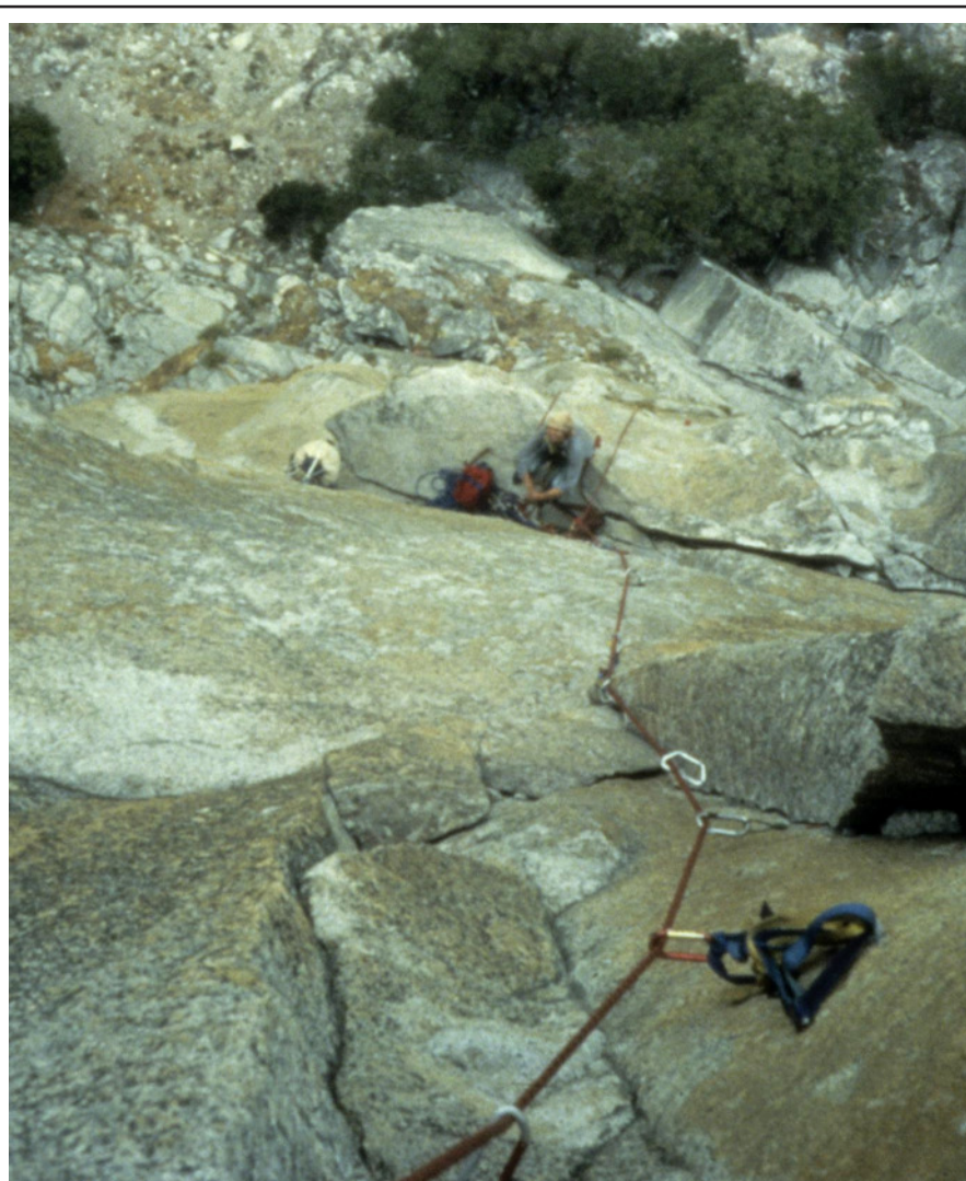
Abb. 1 Das Biwakband; das Drama spielte sich ca. 10 m über dem Fotografen ab