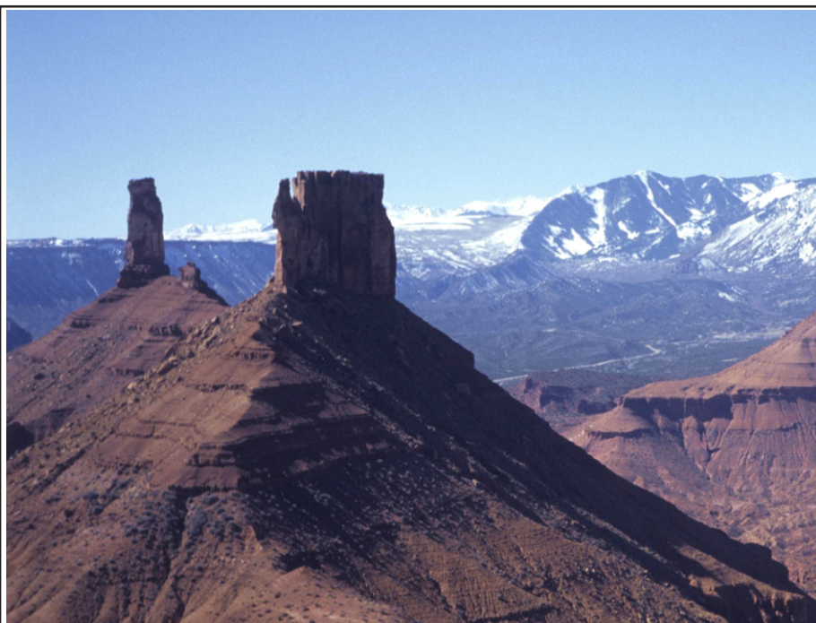
Abb. 1 Castleton Tower und Rectory

Manko stellte sich unser beschränktes Friedsortiment heraus (1 Set), was die Absicherung der häufig parallelen Risse erschwerte. Davon unbeeindruckt machten wir uns auf den steilen Anmarsch zum Rectory. Der Rectory ist eine der freistehenden Mesas mit steil abfallenden Wänden nach allen Seiten (Abb. 1). In der Tat ließen sich dutzende von Rissen und Verschneidungen ausmachen, die diese Wände zur Gänze durchzogen. Leider sahen sie alle zu schwer und/oder zu schrecklich aus. Nach zwei Umrundungen des Massivs in hochsommerlicher Hitze und mehreren frustrierten Versuchen an verschiedenen Stellen stolperten wir wieder die Geröllhalde runter zum Auto. Am Tag vor unserer Abreise Richtung Yosemite beschlossen wir einen weiteren Versuch zu wagen. Diesmal nahmen wir noch ein großes Bündel Haken mit, die eigentlich für den Yosemite-Granit bestimmt waren. Hier sollten sie die fehlenden Friends durch Einnagelung hoffentlich vorhandener Hakenrisse ersetzen.