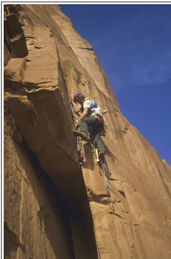
Abb. 2 Die erste Seillänge