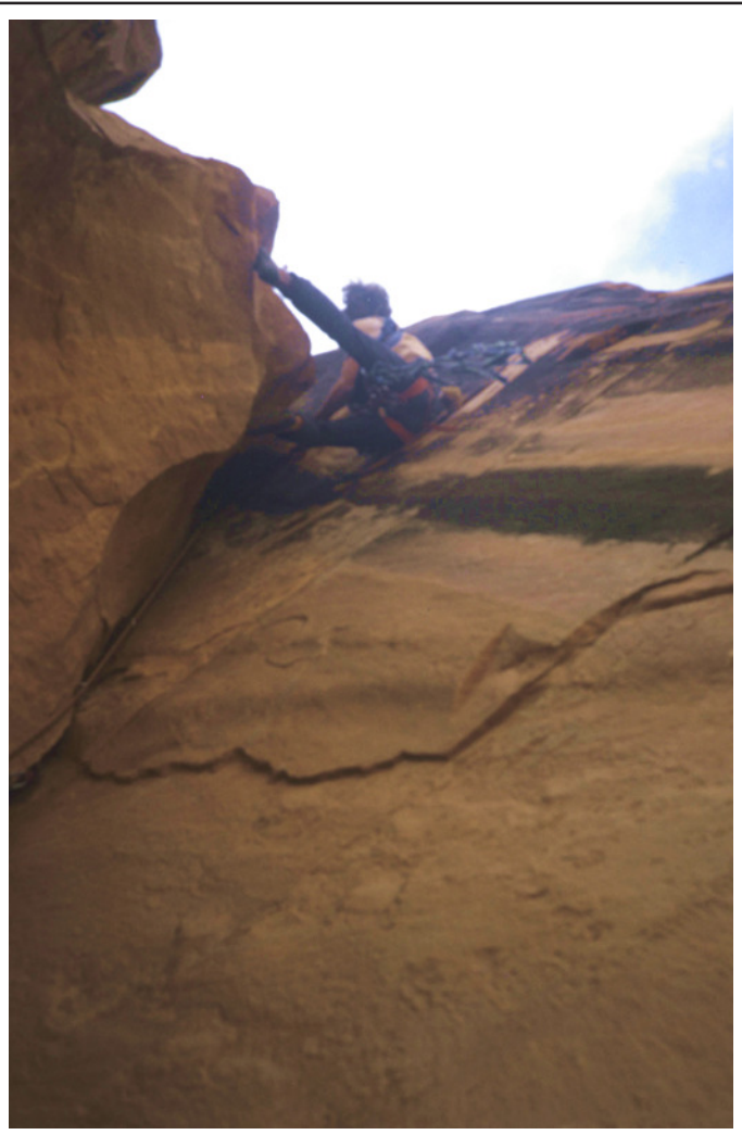
Abb. 3 Die Schlüsselstelle; hier folgt die Seilzugquerung nach links in den Risskamin