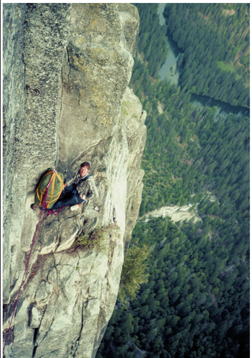
Der zweite Biwakplatz

aufgezehrt gingen die nächsten Seillängen nur sehr langsam voran. Erschwerend kam hinzu, dass wir nur ein Set Jümars besaßen. Der Seilerste musste den Sack also Hand über Hand hochziehen, was teuflisch anstrengend und vernichtend für die Finger war. Es war bereits später Nachmittag als ich beim Sichern mal wieder vor mich hindöste und ab und zu an meiner Camel sog. Plötzlich hörte ich ein ein auf und abschwelldendes Heulen. Irgendwie ging mir durch den Kopf, wie seltsam es war, hier oben einen Rettungswagen zu hören. Im gleichen Moment sah ich meinen Kletterpartner Kopf voran an mir vorbei sausen und registrierte, dass er der Quell dieses Heulens war. Meine mangelnde Aufmerksamkeit resultierte in einer ultradynamischen Sicherung mit einer Fluglänge von satten 15 Metern. Da wir beide klassisch helmfrei kletterten konnten wir uns bei dem überhängenden Gelände bedanken, dass sich der Kamerad